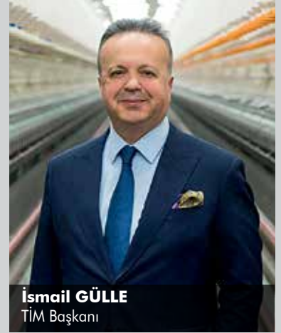
İsmail GÜLLE TİM Başkanı

61 ihracatçı birliği, 27 sektörü ile 85 bin mal ve 5 bin hizmet olmak üzere 90 bin ihracatçısıyla Türkiye'de ihracatın tek çatı kuruluşu olan Türkiye İhracatçılar Meclisi (TİM), ihracatın finansmanına yönelik çalışmalarına bir yenisini daha ekledi. TİM, ihracatçıların yıllık üyelik aidatını kaldırma kararı aldı.