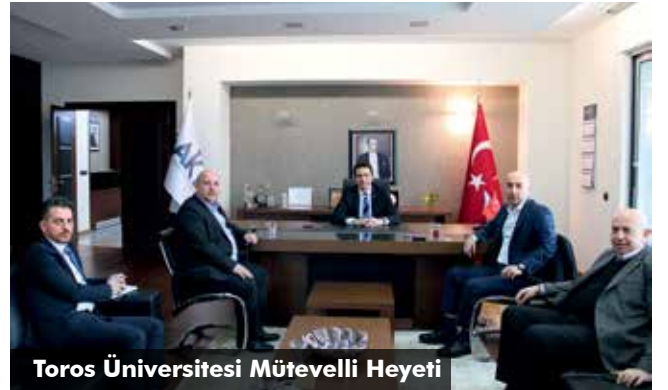
Toros Üniversitesi Mütevelli Heyeti